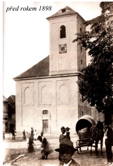
před rokem 1898

Zmínky o trmickém kostele se objevují již v 11. století. V roce 1384 měl trmický farní kostel